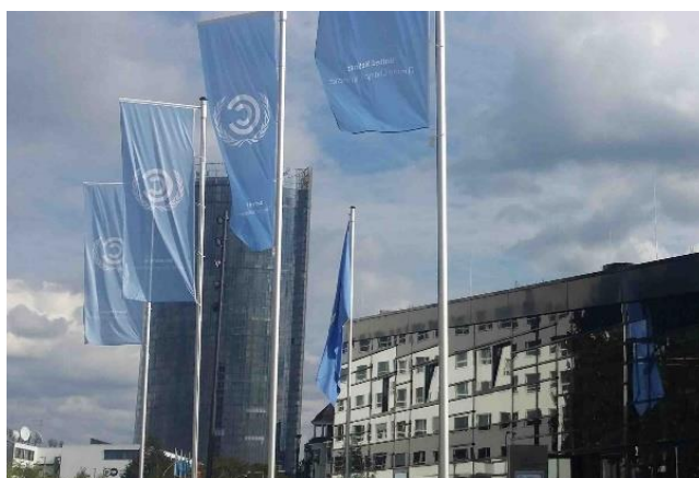
A szakértői tárgyalások helyszíne: a Bonni Világkongresszusi Központ

Az ENSZ Éghajlatváltozási Keretegyezményét 2 1992-ben fogadták el azzal a célkitűzéssel, hogy a nemzetek közös erőfeszítéssel megakadályozzák a veszélyes következményekkel járó globális éghajlatváltozás kialakulását. Az egyezménynek 196 részese van (195 ország és az EU). 1997-ben készült el az egyezmény Kiotói Jegyzőkönyve 3 , amelynek értelmében a fejlett országok az üvegházhatású gázok mintegy 5%-os kibocsátás-csökkentését vállalták 2012 végére az 1990. évi szinthez képest. A Jegyzőkönyv hatálybalépését követően – tíz évvel ezelőtt – született meg az elhatározás arról, hogy a globális probléma miatt egyeztetéseket kell kezdeni az addigiaknál sokkal komolyabb lépésekről 4 . Annak ellenére, hogy nemzetközi és sok országban nemzeti szinten is történtek különféle klímapolitikai intézkedések, mégis a probléma kialakulásáért felelőssé tett gázok kibocsátása összességében gyorsan növekedett.