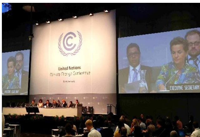
A bonni találkozó megnyitója (2015. aug. 31.): a kivetítőn az egyezmény főtükára (Christiana Figueres, Costa Rica), a pódiumon a tárgyalási munkacsoport társelnökei (Ahmed Djoghlaf, Algéria és Daniel Reifsnnyder, USA)

Az Éghajlatváltozási Kormányközi Testület (IPCC) 5 2007. évi jelentése nyomán ugyan valamelyest felgyorsultak az egyeztetések, de miután 2009-ben sikertelenül végződött a koppenhágai csúcstalálkozó, az ENSZ Éghajlatváltozási Keretegyezményében Részes Felek új tárgyalási megközelítésben állapodtak meg (Durban, 2011) 6 . Ennek eredményeképpen elfogadták a Kiotói Jegyzőkönyv „meghosszabbítását” (Doha, 2012) 7 , azaz mindenekelőtt a fejlett országok számára előírt kibocsátás-csökkentési kötelezettségek szigorítását a 2020-ig tartó időszakra. Az EU-28-ak együttesen 20%-os kibocsátás-csökkentést vállaltak az 1990. évi kibocsátási szinthez képest. A megállapodásból azonban kimaradt a fejlettek közül öt „nagykibocsátó”: Japán, Kanada, Oroszország, Új-Zéland, USA. E fejlett országok világossá tették, hogy a továbbiakban csak olyan nemzetközi megállapodásban vesznek részt, amelynek keretében a gyors gazdasági növekedésű fejlődő országok is tesznek klímapolitikai vállalásokat. Az EU tagállamai hasonló feltételt támasztottak ahhoz, hogy az említett 20%-os szintnél nagyobb mértékű csökkentésre vállaljanak jogi kötelezettséget.