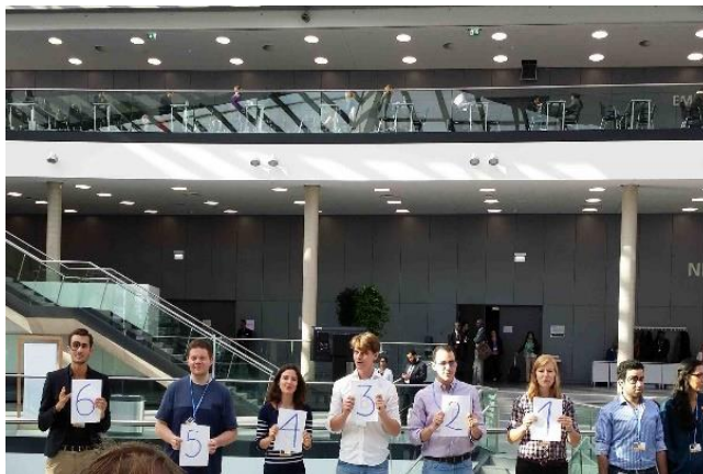
Civil „figyelmeztetés” a bonni találkozó utolsó napjának reggelén (szept. 4.): már csak 6 tárgyalási nap maradt a párizsi ülészakig (beleértve az októberi szakértői találkozót öt napját)

találkozót követően annak nemzetközi sajtóvisszhangja is meglehetősen negatív volt. A klímátárgyalások túlzottan lassú menetét már eddig is többször bírálta az ENSZ-főtitkár is, aki szeptember végére ebben az ügyben konzultációra hívta meg negyven ország vezetőjét abban a reményben, hogy a megállapodás útjában álló legkritikusabb kérdésekben majd e találkozó hozzájárulhat a megfelelő politikai kompromisszumok eléréséhez.