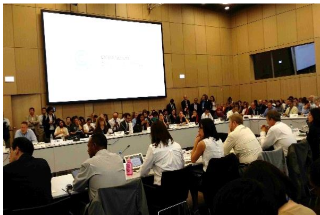
Az egyes témakörökről, azok szövegtervezeteiről külön vitatkoztak a kormányzati delegációk képviselői (a különböző érdekképviseleti csoportok tagjainak jelenlétében, akik megfigyelőként vehették részt)

A 2020-ig tartó időszakra a fejlett országok kötelezettségvállalási „tétjeinek” emeléséről és a Kiotói Jegyzőkönyv „meghosszabbításának”, azaz 2012. évi Dohai Módosításának hatálybalépéséről több mint két éve meglehetősen terméketlen vita folyik. A majd erről szóló és várhatóan elfogadásra kerülő határozattervezet általánosságban felszólítja a Módosításban érintett és az abból kimaradó fejlett országokat is arra, hogy a megígért kibocsátás-csökkentésnél többet vállaljanak, valamint teljesítsék a nemzetközi finanszírozásra vonatkozó politikai vállalásukat. Politikai szándék és egyetértés hiányában ennél több nem várható, s még az is felettebb kétséges, hogy a közeljövőben egyáltalán hatályba lép-e ez a Dohai Módosítás, hiszen ennek teljesülése nehezen elérhető feltételhez kötött: ehhez legalább 144 országnak kell hivatalosan elfogadnia e jogi eszközt, miközben eddig ennek kevesebb, mint negyvenen tettek eleget. (Egyelőre a „hiányzók” között van együtt az EU 28 tagállama is.). Ugyanakkor a fejlődő országok elengedhetetlennek tartják, hogy ebben az ügyben előrehaladás legyen és ragaszkodnának egy „szigorú” tartalmú és hangvételű határozathoz.