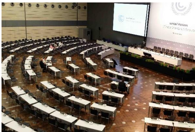
A bonni tárgyalások helyszíne: a plenáris tárgyalóterem majd októberben fog újra megtelni a résztvevőkkel

Ugyanakkor az eddigi előkészületek alapján erősnek látszik a magasszintű politikai akarat ahhoz, hogy 2015 végén megszülessen egy új nemzetközi jogi eszköz: egy Párizsi Megállapodás az ENSZ Éghajlatváltozási Keretegyezményének hatálya alatt. Valójában a leendő Megállapodás tartalmával és nemzetközi jogi erejével kapcsolatban jelentősek a kételyek. A fejlett és a fejlődő országok közötti ellentétek és ezen országcsoportokon belüli eltérő álláspontok miatt sem látszik valószínűnek, hogy a konkrét számszerű kötelezettségvállalásokra vonatkozóan egyértelmű, jogilag kötelező érvényű, a végrehajtásukat pontosan ellenőrizhetővé tevő rendelkezések lesznek a Megállapodásban, hanem feltehetően csak a vonatkozó általános eljárási szabályokat írják elő kötelező módon. E szabályok alapján lehetne elvárni mindenkitől, azaz a Megállapodáshoz csatlakozó minden országtól, hogy meghatározott határidőkre és időközönként, ill. elemekkel közlésezi majd konkrét vállalásait, valamint az azok végrehajtásával kapcsolatos előrehaladási jelentéseit.